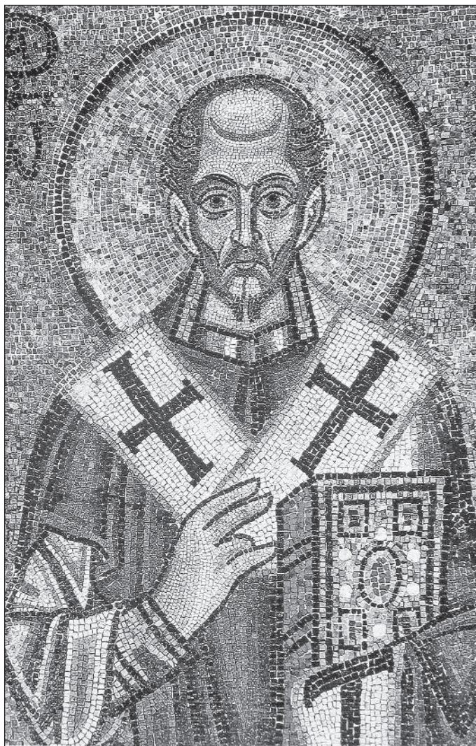
Святитель Иоанн Златоуст. Мозаика. XI в. Киев. Собор святой Софии